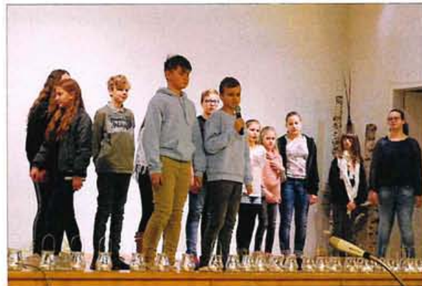
Schüler/Innen von Ruth Rastetter sprechen die Motette: "Gegen das Vergessen"