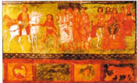
Wandmalerei aus der Synagoge von Dura Europos/ 3.Jh./Buchrolle Esther: Mordechai auf dem Pferd, von Haman geführt, auf dem Thron Ahasveros. Mordechai als Beispiel für einen "Resch Galutha".