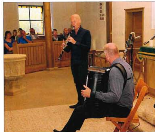
Konzert in Adelshofen mit dem Duo Winkler /Kellerer