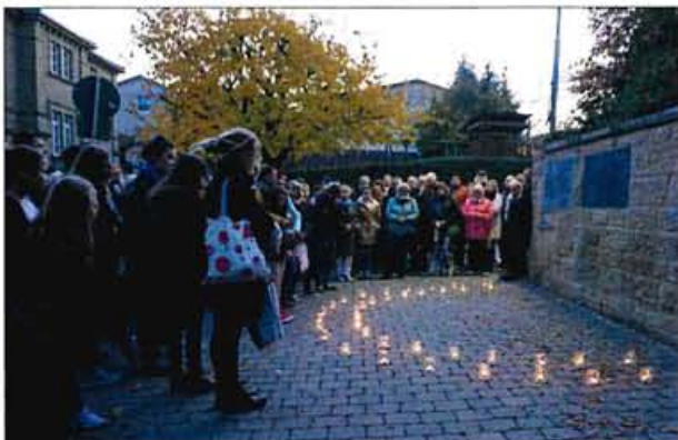
Teil I am Platz der ehemaligen "Neuen Synagoge": 38 Gedenklichter für 38 jüdische Eppinger