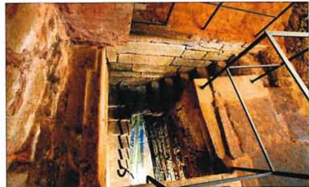
Mikwe / Jordanbad Eppingen

Europäischer Tag der Jüdischen Kultur JLK-Mitglieder erklären Besuchern die Eppinger Mikwe/Jordanbad und den Hochzeitsstein der Alten Synagoge in der Küfergasse.