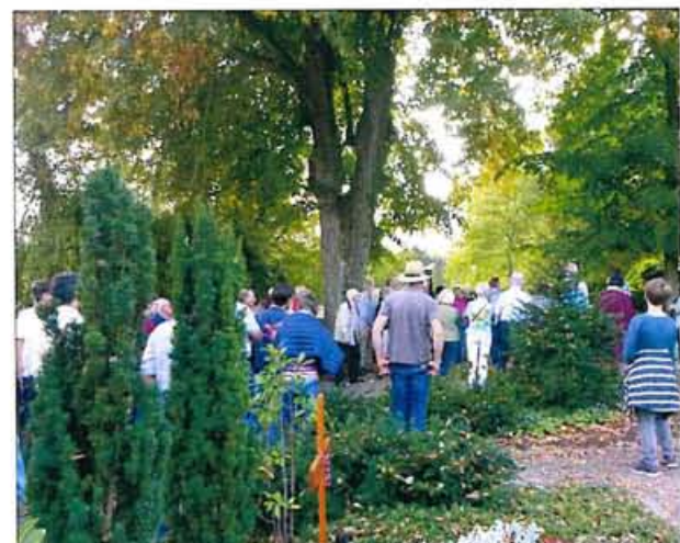
Angelbachtal-Michelfeld: Jüdischer Friedhof

Die Berichte von Alexander Hettich und Angela Port- ner erscheinen im Laufe des Oktobers 2018.